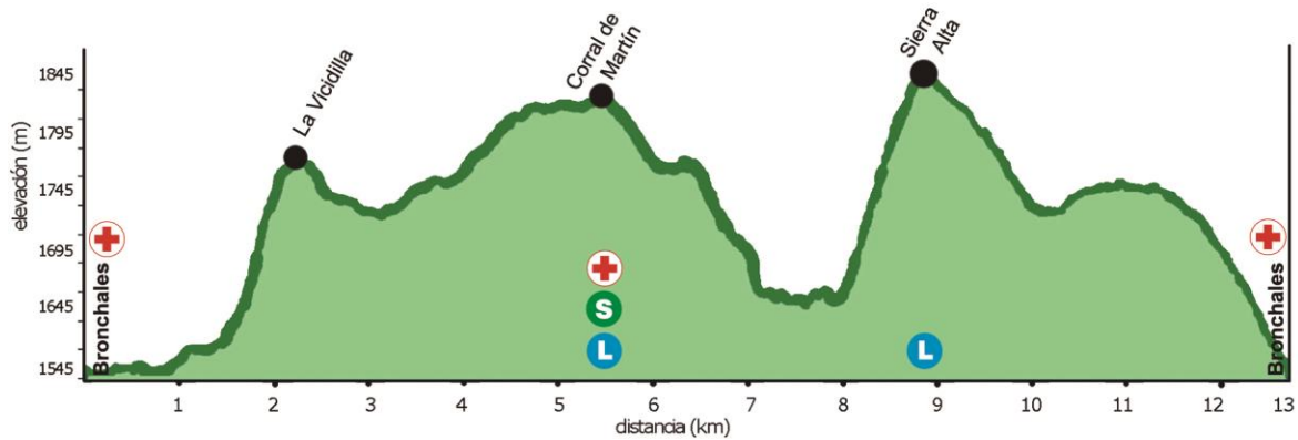
13K TRAIL +535m

A continuación, se detallan los perfiles de cada una de las pruebas: