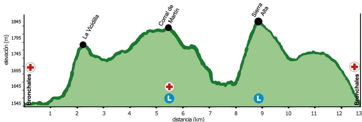
13K TRAIL +535m

A continuación, se detallan los perfiles de cada una de las pruebas: